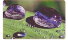
Diese Oberfläche stößt Wasser ab.

Ohne Verlaufshilfsmittel würde Silikon, wie das Wasser auf diesem Foto von der Oberfläche abgestoßen.