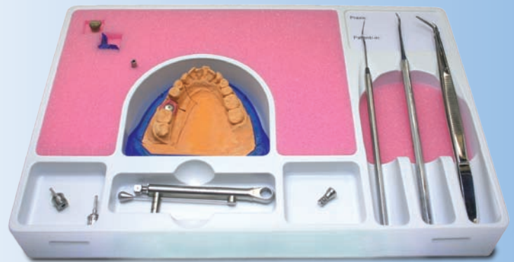
Die abgebildeten Instrumente sind nicht im Lieferumfang enthalten!